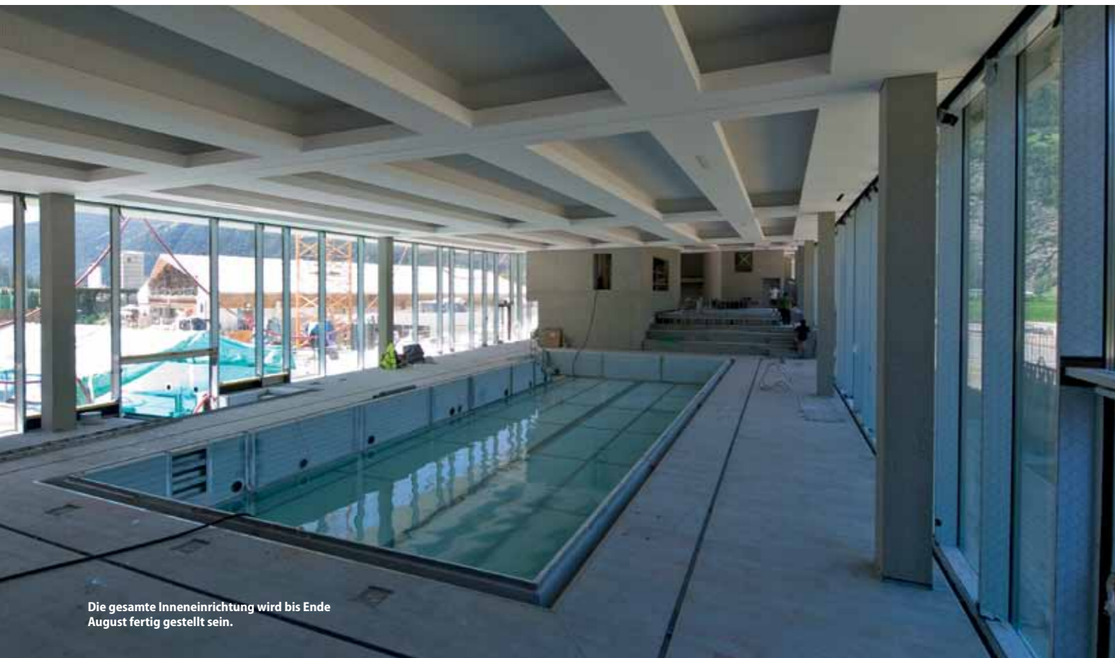
Die gesamte Inneneinrichtung wird bis Ende August fertig gestellt sein.

MODERNE ARBEITSPLÄTZE FÜR DIE BEVÖLKERUNG: ZWEI DRITTEL DER KÜNFTIG 30 BESCHÄFTIGTEN SIND FRAUEN, DARUNTER VIELE TEILZEITBESCHÄFTIGTE.