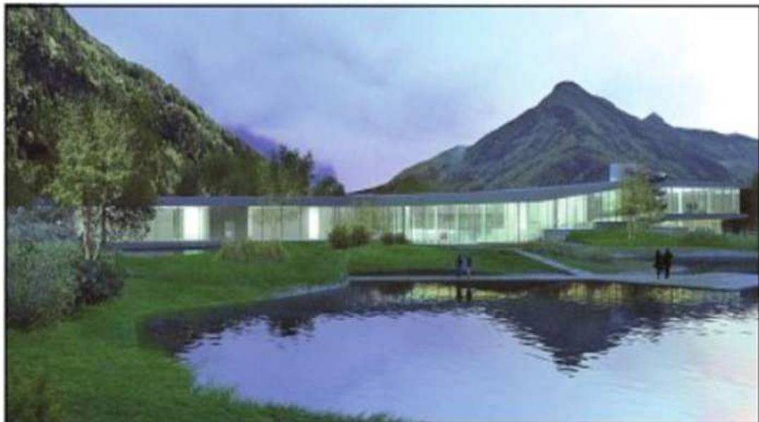
Bürgermeister Innerbichler geht davon aus, dass bald mit dem Bau des Hallenbades Cascade begonnen wird. Das Projekt stammt von Christoph Mayr Fingerle.

Geführt werden soll das Bad samt Restaurationsbereich von